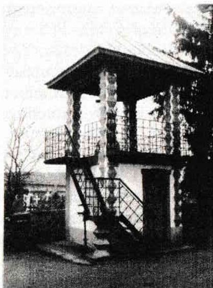
Clopotnița bisericii de la Drăgănescu-București, având ca stâlpi de susținere „Coloana infinită” a lui Brâncuși

- Cel cu un talant din Sfânta Evanghelie are numai botezul și talantul lui i se va da celor fără botez, dar cu fapte.