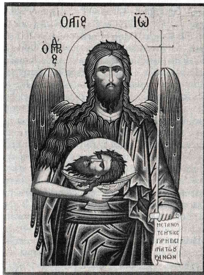
Sfântul Ioan Botezătorul, capătul proorocilor Vechiului Testament

Ura împotriva Romei era la culmea mocnirii. În pustia Iordanului Ioan striga răspicat și plin de nădejde: „Pocăiți-vă, căci s-a apropiat Împărăția Cerurilor”.